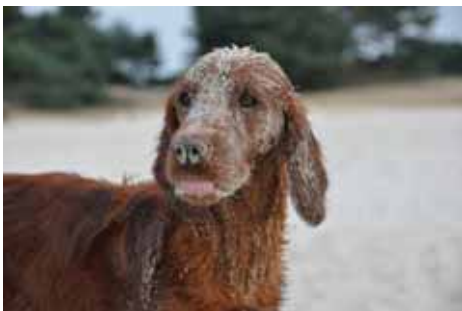
Eilyn im Sand...