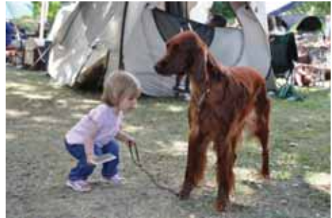
Ist Eilyn genug gekämmt?